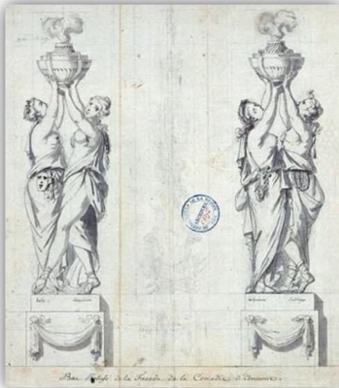
Jacques-Pierre-Jean Rousseau, ingénieur des ponts et chaussées, puis architecte de la ville d'Amiens, reliefs de la façade du théâtre de la ville, 1778, Archives départementales de la Somme

Organisée par les universités Bordeaux-Montaigne, Paris-Sorbonne, Paris-Ouest, avec le concours du GHAMU