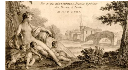
Louis de Régemortes, frontispice de son ouvrage consacré au pont et aux embellissements de Moulins, 1771, A.D. Allier