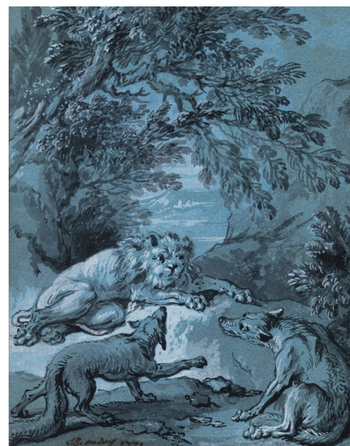
Jean-Baptiste Oudry, Le lion, le loup et le renard , pinceau, encre noire, lavis gris, rehauts de gouache blanche sur papier bleu, collection privée © Guillaume Benoit

Du triptyque cynégétique commandé à Oudry par le prince de Condé et représentant des chasses au loup, au renard et au chevreuil, seules les deux premières compositions sont encore conservées au château de Chantilly. Toutes trois installées dans la salle des Gardes du château, elles sont saisies à la Révolution puis séparées sous la Restauration : tandis que les chasses au loup et au renard sont restituées à la famille de Condé, La chasse au chevreuil est transférée au musée des Beaux-Arts de Rouen en 1820.