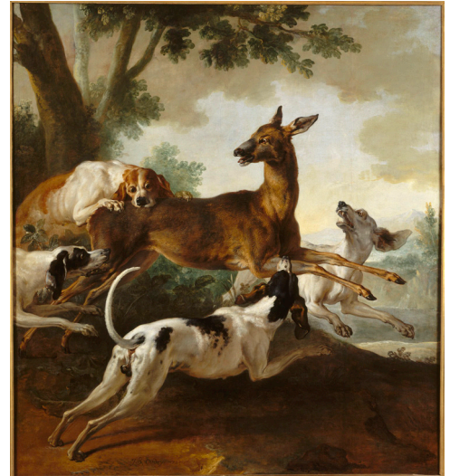
Jean-Baptiste Oudry, La Chasse au chevreuil ou Le chevreuil forcé , 1725, huile sur toile, 171x156 cm, Rouen, musée des Beaux-Arts

L'exposition sera également l'occasion de redécouvrir l'édition originale des Fables de Jean de La Fontaine illustrées par Jean-Baptiste Oudry publiée en 1992 par les éditions Diane de Selliers. Ce livre, aujourd'hui épuisé et réédité avec une nouvelle reliure, est un trésor pour les amateurs de littérature et d'art. Des exemplaires de cette réédition en Petite Collection seront mis à disposition des visiteurs pour laisser la possibilité de feuilleter les fables et de découvrir les 275 illustrations d'Oudry.